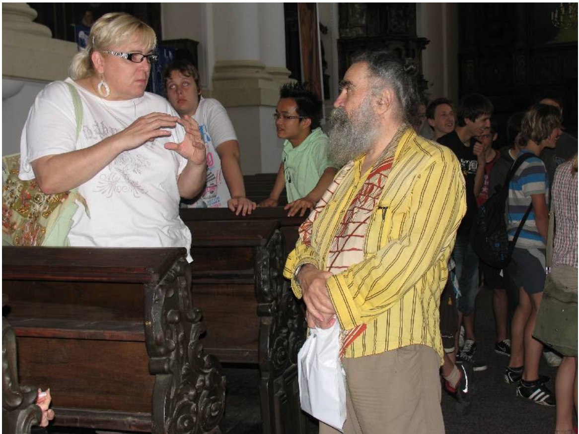
I paní učitelka byla zaujata povídáním malíře a na spoustu věcí se vyptávala. Kupodivu nás všech i ona o křížové výpravě a křesťanech velmi zajímavě povídala.