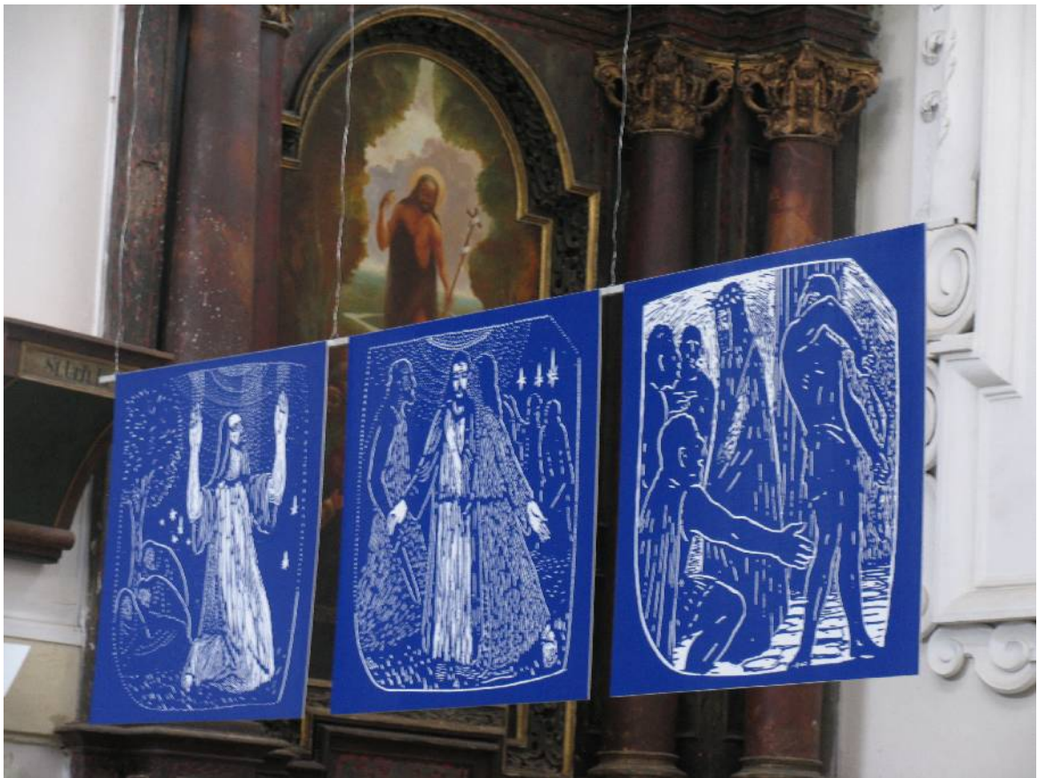
Výjevy z křížové cesty byly vytištěny na veliká plátna. Pan Sopko nám popisoval i techniku vyhotovení.